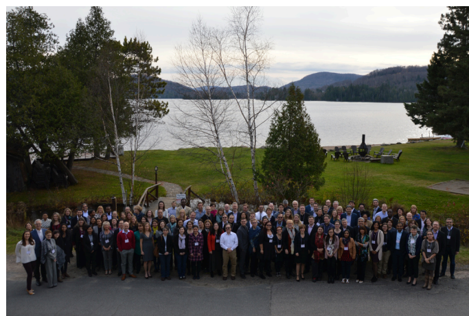
Réunion scientifique annuelle, Mont-Tremblant, 2017