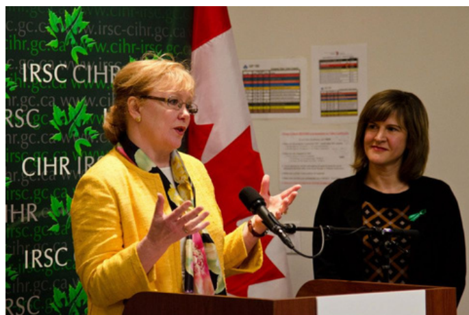
Annonce des IRSC, avril 2013